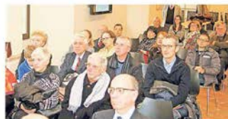
Il pubblico presente ieri al convegno sulla talassemia in Castello