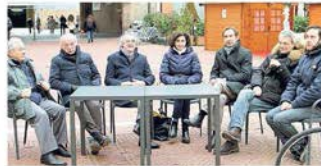
I protagonisti del dibattito sulla mobilità ieri a Ferrara

da del veicolo e in queste classifiche sono secondi a livello nazionale dietro solo Rovigo. Durante il dibattito dove so-